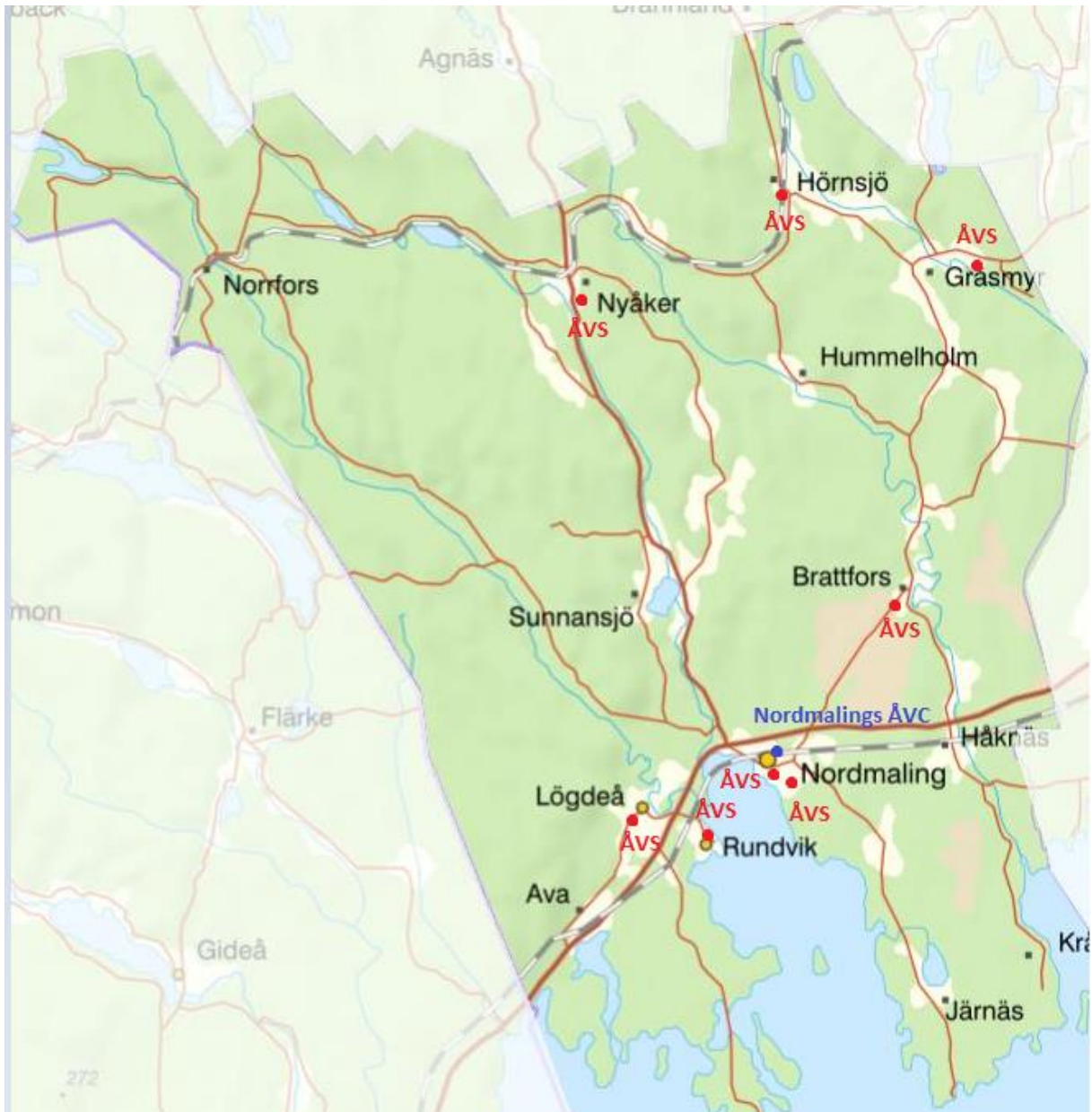
Karta över Nordmalings kommun. Röda prickar visar Nordmalings återvinningsstationer (ÅVS) och den blå prickken visar Nordmalings återvinningscentral (ÅVC)